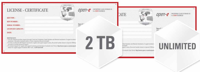
Storage Extensions von 2TB, 4TB, 8TB, 16TB bis hin zu unbegrenzter Kapazität