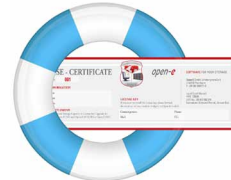
1 Jahr / 3 Jahre 24/7 Support