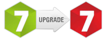
Upgrade von Open-E DSS V7 Lite auf Open-E DSS V7