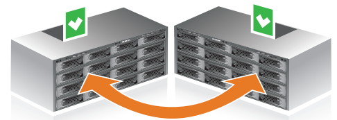
Feature Pack Active-Active iSCSI Failover