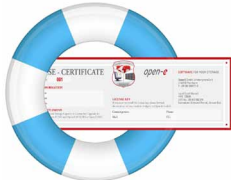
1 Jahr / 3 Jahre Basic Support