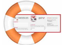
Einmaliger Vorfall 24/7 Support