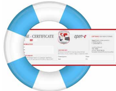
1 Jahr / 3 Jahre Premium Support